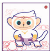
七彩哈奴曼兒 童方巾