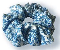
髮圈國寶紋飾- 青花纏枝