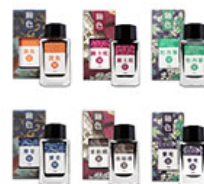
釉色鋼筆墨水6 色套組