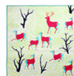
手絹-丹楓呦鹿 35x35 cm