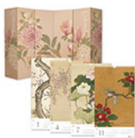
2023年故宮花卉大賞-故宮名畫月曆