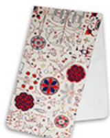
團花動物紋運動毛巾