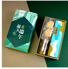
【龍翠傳情】 三希堂錦玉端午禮盒