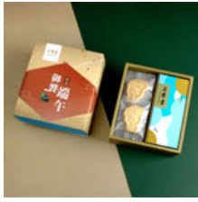
【龍翠傳情】 三希堂御饗端午禮盒