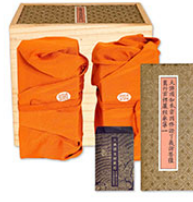
大佛頂首楞嚴 經 (宋紹興九年刊本)