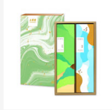
三希堂端午節 禮盒【蜂姿綽約】