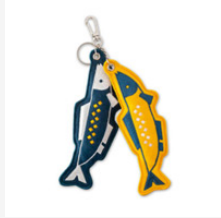
年年有魚串-刺繡吊飾/鑰匙圈 黃藍