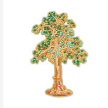
瑞樹圖立體冰 箱貼