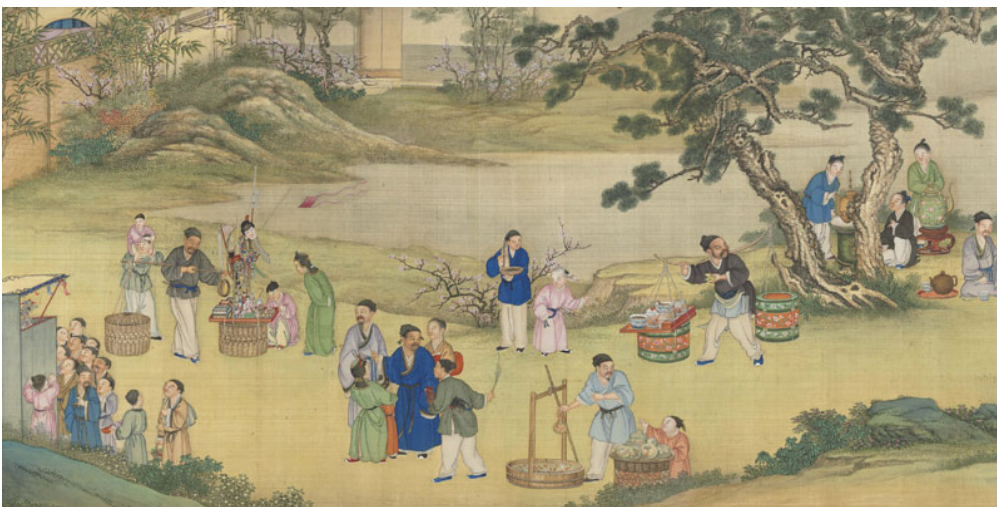
清 丁觀鵬 太平春市圖