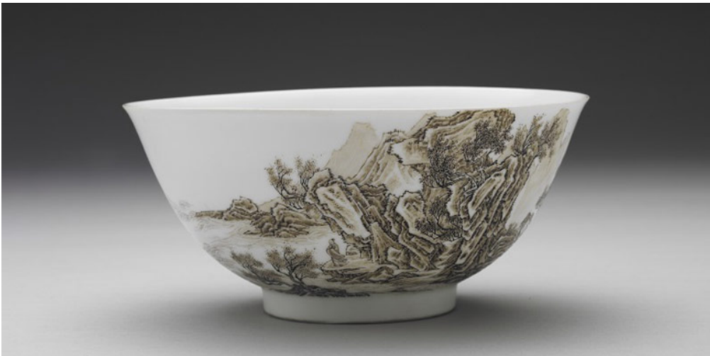
清 雍正 琺瑯彩赭墨山水碗