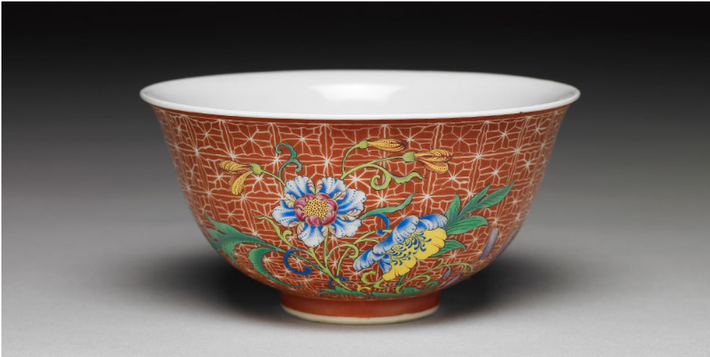
清 乾隆 琺瑯彩紅地剔花花卉魚藻茶碗