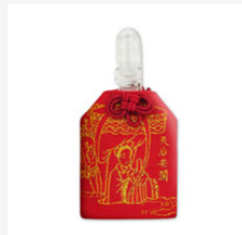
天后安瀾刺繡 隨身福袋