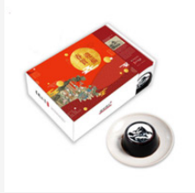
春賀迎福 2021 年春節限定版 墨戲仙草禮盒