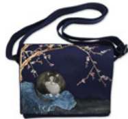
沈振麟紅梅狸 奴小書包