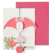
蝠氣吉荔紙掛 飾卡片