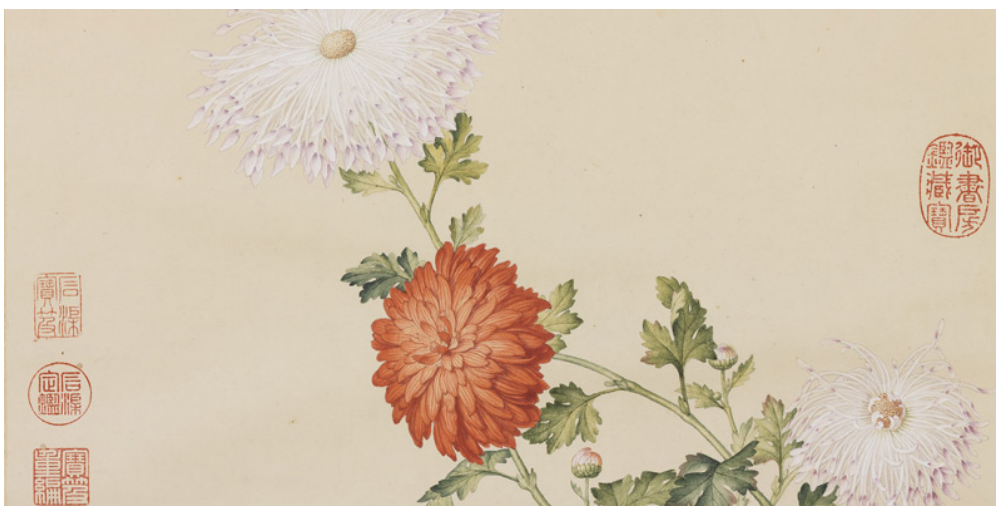
清 郎世寧 畫洋菊

本卷未署年款，研究者指出應為《餘清齋法帖》彙刻〈十七帖〉的臨本，時間在萬曆二十四年（1596）之後，可據以理解明代末期〈十七帖〉流行的時代背景，以及董氏臨古與考據並重的書學態度。