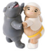
玉人與熊親親 磁吸夾