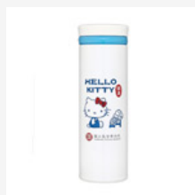
不銹鋼真空保溫杯-故宮 X HELLO KITTY