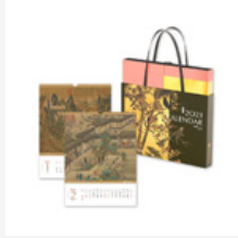
2021年故宮名畫大月曆(精美盒裝)