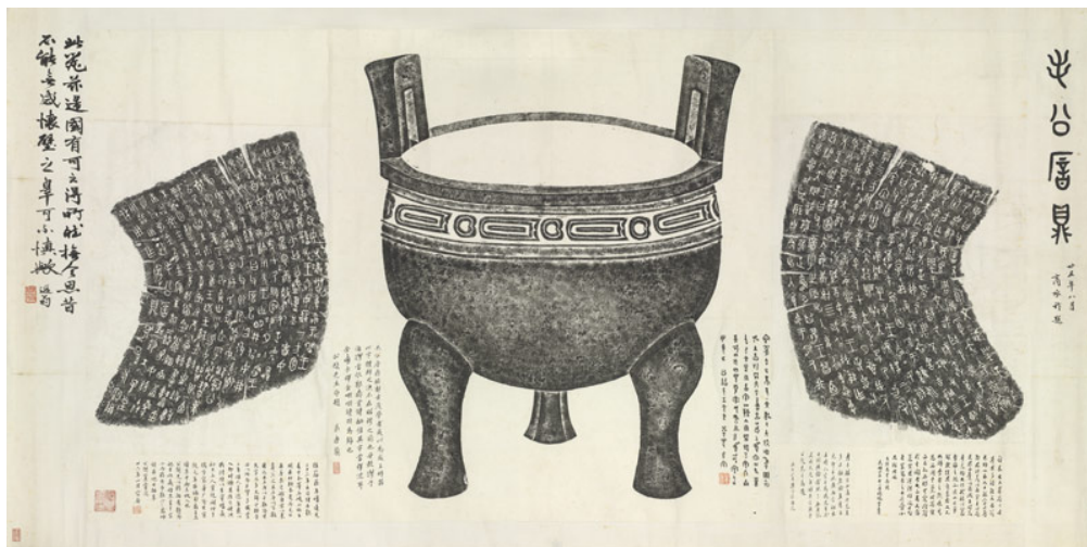
周 毛公鼎全形拓本

「職貢圖」是描繪邦交國、藩屬國與邊地部族的圖像，不論是刻畫遠來朝覲的使節，或者以各地貢物象徵四方來朝，皆可視為廣義的「職貢圖」。職貢圖具有展示國力、象徵民族融合，展現大一統氣象的意義，因此備受統治者重視，經常由朝廷敕命繪製萬國來朝的盛況。