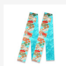
日式菊竹紋配 飾窄巾