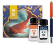
袖色筆墨組 靈青游 魚轉心瓶