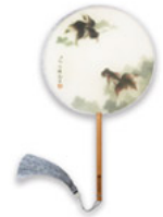
富貴有餘 真絲團扇