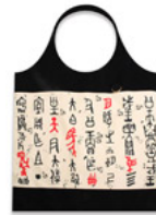
作冊大方鼎肩背休 閒包