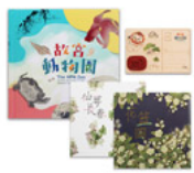
故宮動物園圖冊 +故宮花卉立體卡 套組(隨書附贈印國 寶-愛獅)