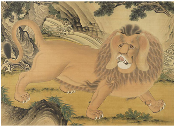
清 劉九德 畫獅

式標本、獸皮和布偶，兼具文化美學及生態教育意義，絕對是今夏不容錯過的親子出遊好去處！