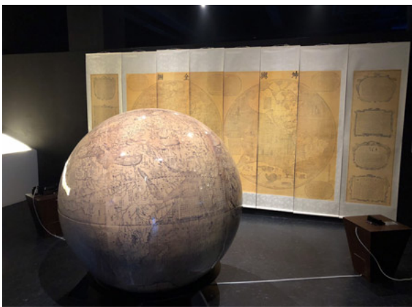
新媒體作品—南懷仁的坤輿圖說世界