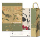
2020年故宮大月曆 (精美盒裝)