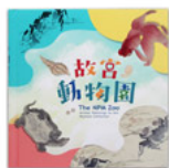
故宮動物園 (隨書 附贈印國寶-愛妮)