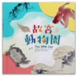
故宮動物園 (隨書附贈印國寶-愛狹)