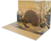
DIY立體手作卡片 - 畫孔雀開屏