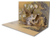
DIY立體手作卡片 - 畫交趾果然