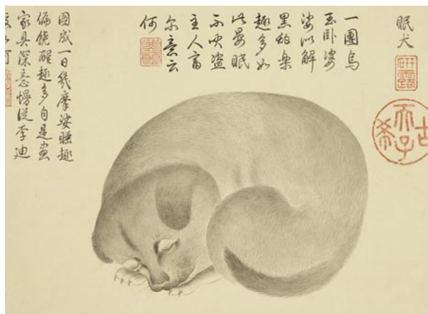
清 金廷標 眠犬

高雄市立美術館 | 故宮x高美館：國寶新境—新媒體藝術展(2019/09/07~12/01)