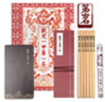
【期間限定】第一 名福袋組