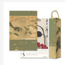
2020年故宮大 月曆(精美盒裝)