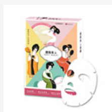
唐風美人面膜 組合包 (4入)