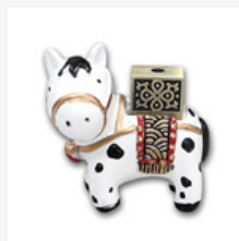
天韻神香-太平 寶馬·香插