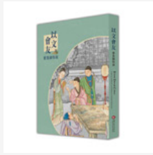
以文會友-雅集 圖特展