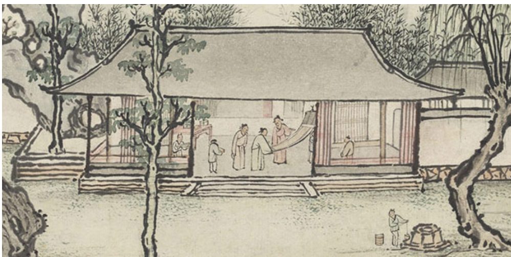
明 孫克弘 銷閒清課圖