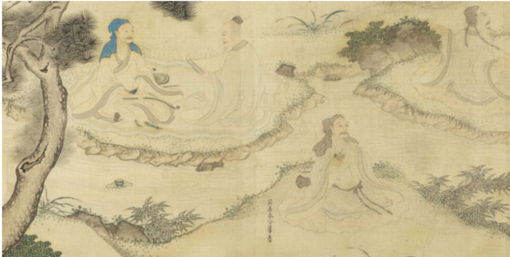
明 李宗謨 蘭亭修禊圖(局部)

此作描繪二十種明代後期文人的閒雅生活，每段加上點題數語。透過圖像與文字，可感受到不少與文震亨類似的生活講究。