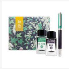
釉色筆墨組 紫 地粉彩花鳥盒