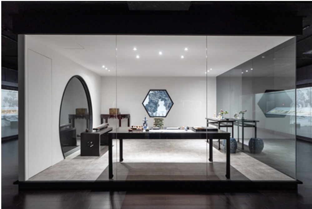
「小時代的日常——一個十七世紀的生活提案」展場一隅